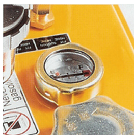
VAL olajsint kijelzéssel. (kivéve VAL 6 KB)