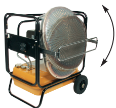
Függőlegesen dönthető, kivánt helyzetben reteszelve.