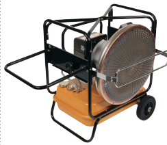
Felhajtható tolorúd - VAL MIDI esetén.